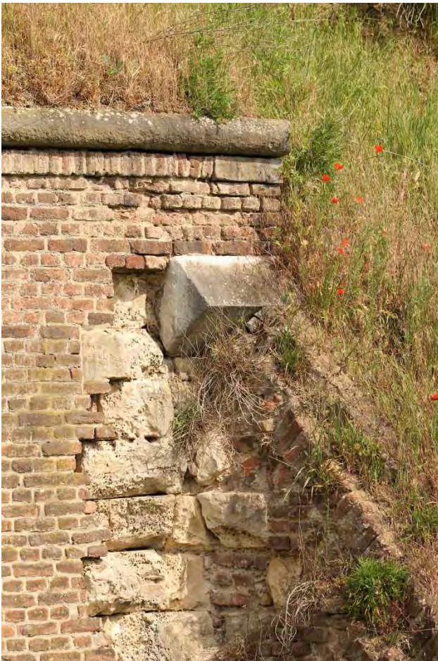
Figuur 2. Maastricht, nestplek van bijen in de Hoge Fronten.

De bijenfauna van stedelijke gebieden kan zeer rijk zijn. In deze paragraaf sommen we enkele oude en diverse recente bijeninventarisaties in stedelijke gebieden uit ons land op. Alle inventarisaties vonden plaats in delen van stedelijke gebieden, dus de