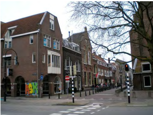
Figuur 1. Veel stenige elementen, Waterstraat Utrecht.

Een stad kan niet los worden gezien van haar omgeving. De steden waren vroeger vaak door stadsmuren en stadgrachten scherp begrensd en duidelijk gescheiden van het platteland. Na de industriële revolutie vervagen deze grenzen. Ongeveer vanaf 1900 ontstaan ook groepen van steden. De ruimten waarin die groepen voorkomen noemen we stedelijke gebieden. Na de tweede wereldoorlog zien we dat het verstedelijkingsproces uitwaaert over het platteland en vervaagt de grens tussen stad, dorp en platteland. In werkelijkheid bestaat er geen grens