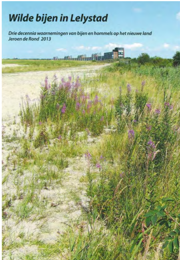
Figuur 5. Voorpagina verslag bijeninventarisatie Lelystad.

fraaie tekeningen van de auteur. Daarna worden per genus de soorten kort beschreven en informatie over de biologie gegeven, zoals vliegtijd, bloembezoek, de verspreiding in Nederland en in Lelystad. Van elke bijensoort is een verspreidingskaartje van de soort in de gemeente Lelystad. In totaal zijn 120 soorten wilde bijen geïnventariseerd.