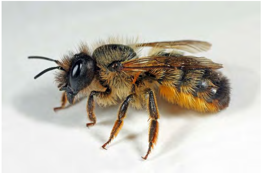
Figuur 7. Vrouw rosse metselbij Osmia bicornis .

In 2018 verscheen een clusteranalyse van de bijen- en zweefvliegenfauna van landschapstypen in ons land (Ozinga et al. 2018). In deze studie is gebruik gemaakt van gegevens per km-hok uit de periode 2002-2016.