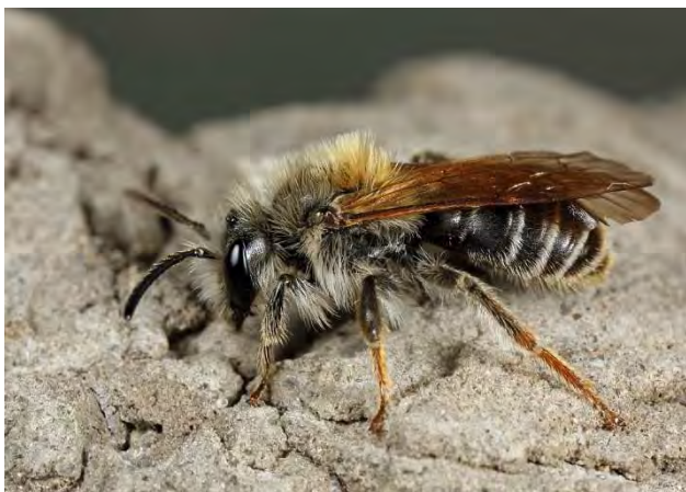
Figuur 6. Man wikkebij Andrena lathyri .

In Tilburg werd in 2018 begonnen met een nulmeting (Raemakers et al 2019). De bijenmonitoring is gericht op bermen in het buitengebied en vergroeningsplannen voor het centrum. Bij het bermonderzoek (12 bermen van 50 meter) worden ecologisch en regulier beheerde bermen onderzocht en tevens enkele bermen die door Food4Bees bijvriendelijk zijn ingezaaid. De effecten zullen langjarig worden bekeken. Voor het stadsgroen zijn 14 proefvlakken geselecteerd variërend van stadsparken, braakliggend terrein tot industriegebied. Er werd gemonitord van april tot in september waarbij ook bloembezoek, bloemaanbod en nestgelegenheid werden genoteerd. Tijdens het