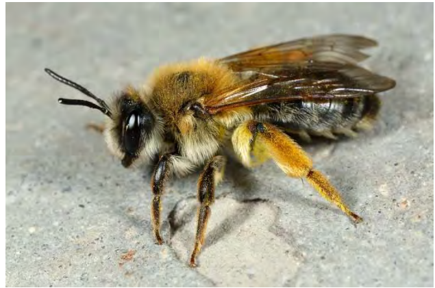
Figuur 8. Vrouw grijze rimpelrug Andrena tibialis .