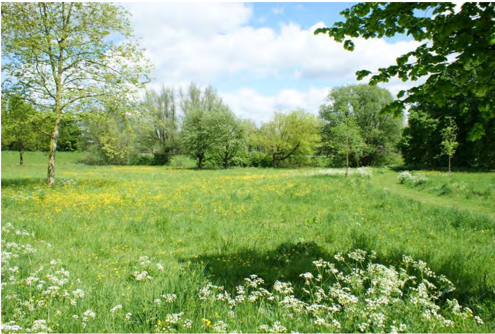
Figuur 3. Deventer, park bij de Jan luykenkolk.

terrein genoemd, evenals andere opmerkelijkheden met betrekking tot bijen. Het huidige beheer van dat terrein wordt kort geschetst en er worden adviezen gegeven voor het beheer, die gunstig zijn voor bijen. In de bijlagen staan de soortenlijsten, met daarbij vermeld in welk terrein de soort voorkomt. Per soort wordt de status en de zeldzaamheidsklasse benoemd.